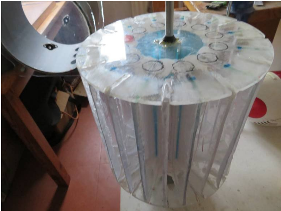
poids 2 kg environ