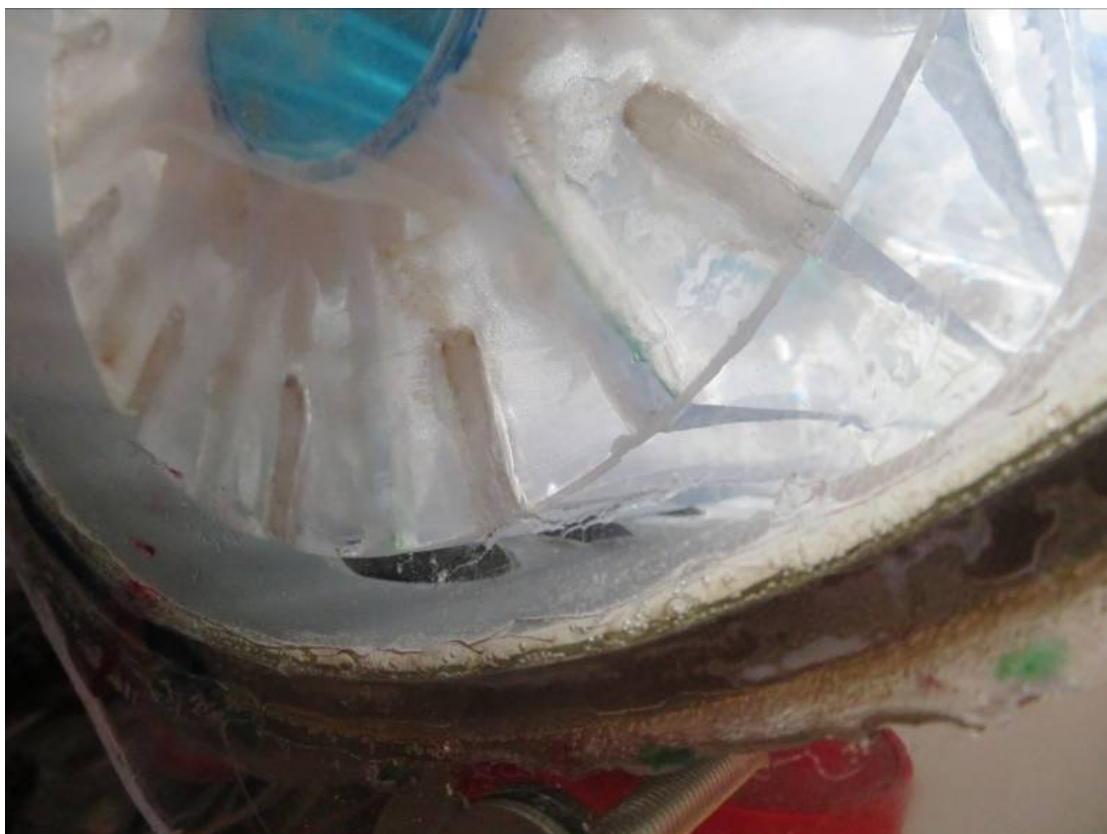
Colle + soudures à chaud