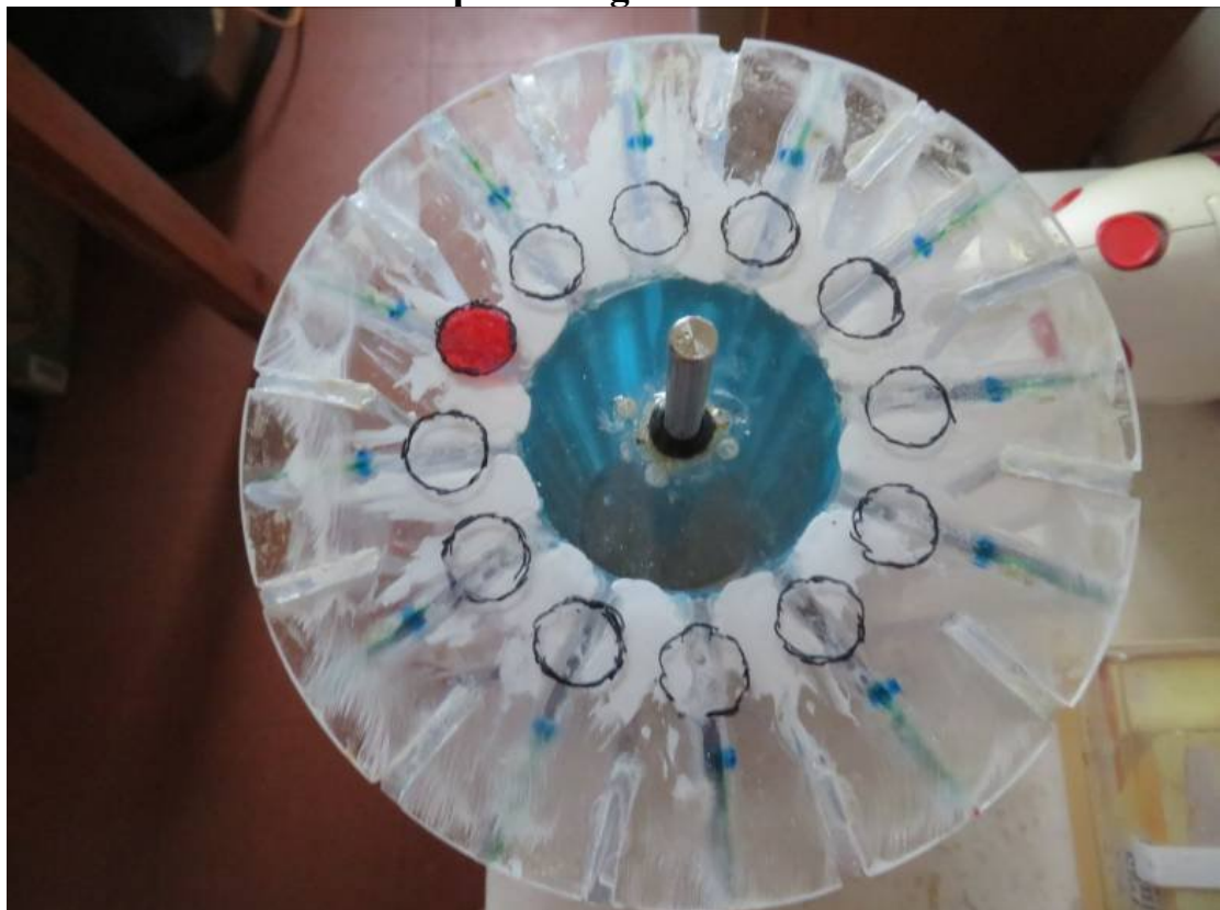
Point rouge permet de compter les rpm